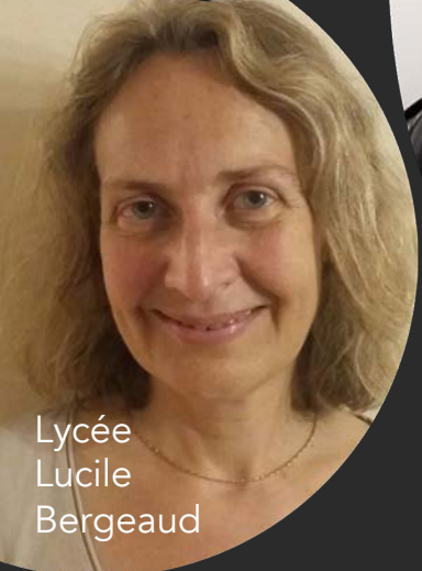
Lycée Lucile Bergeaud

Des enfants au collège = 1 vote au collège par parent Des enfants au lycée ou en Classes Préparatoires = 1 vote au lycée par parent Les deux parents votent (sur place ou par correspondance)