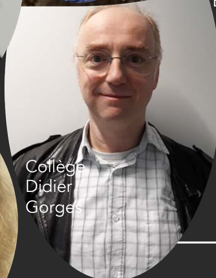
Collège Didier Gorges

Plus nous aurons de sièges au conseil d'administration, plus nous pourrons avoir de représentants de parents FCPE aux conseils de classes, dans les diverses instances et plus nous aurons de poids auprès de l'inspection et des administrations. Vous souhaitez faire entendre votre voix en conseil de classe, vous voulez que votre enfant soit défendu ? Vous souhaitez être informé, conseillé?