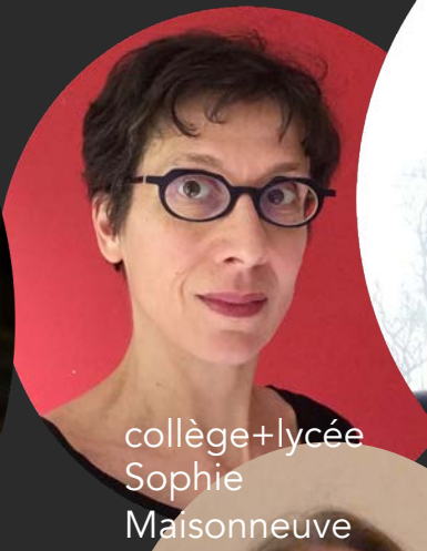
collège+lycée Sophie Maisonneuve