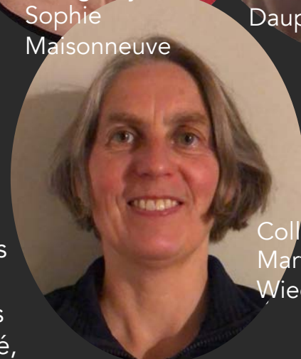
Collège Martina Wiedner