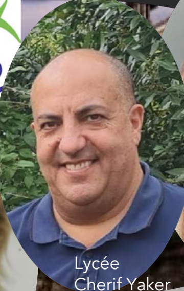
Lycée Cherif Yaker