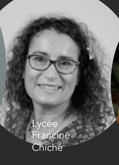
Lycée Francine Chiché